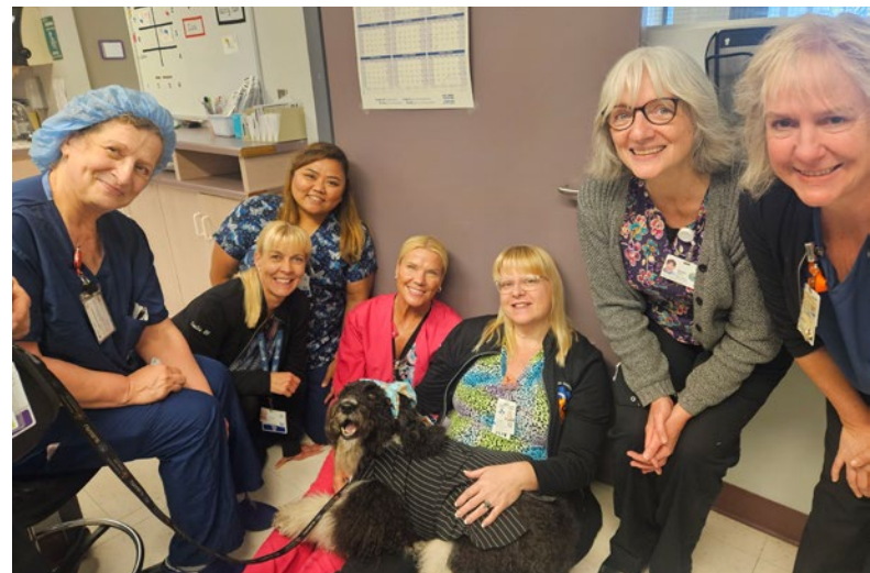
Visites de zoothérapie dans les unités pendant la Semaine des soins infirmiers