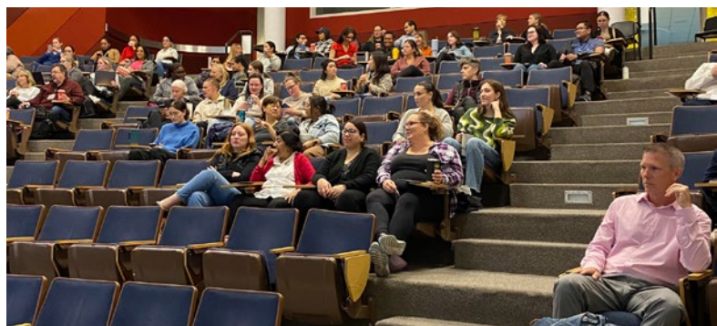
Journée d'enseignement sur la prévalence des soins infirmiers, octobre 2024

En mesurant continuellement ces connaissances et en agissant en conséquence, l'Hôpital favorise une culture de prise de décisions fondée sur les données, en veillant à ce que les infirmières disposent des outils et du soutien nécessaires pour fournir des soins sécuritaires, de haute qualité et compatissants.